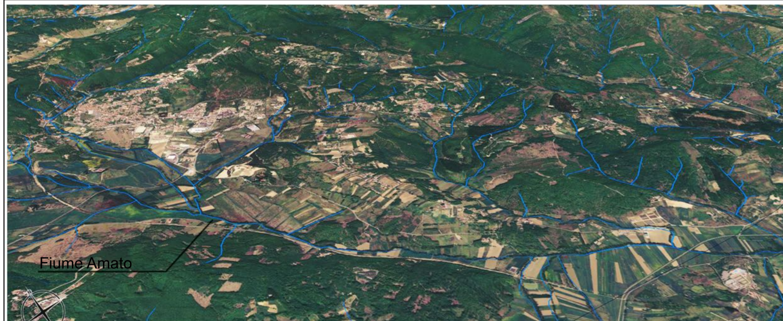
Vista aerea del reticolo idrografico nel territorio di Soveria Mannelli

Città di Soveria Mannelli Partita IVA: 00297290793 Palazzo Cimino - Via Dr. Cimino - 88049 Soveria Mannelli (CZ) +39 0968.662006 info@soveria.it protocollo@soveria.it protocollo@pec.soveria.it Numero Verde 800274501